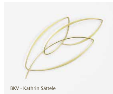
BKV - Kathrin Sättele

im Ruffinihaus am Rindermarkt 10, München »02