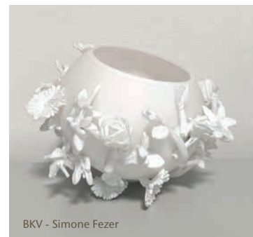
BKV - Simone Fezer