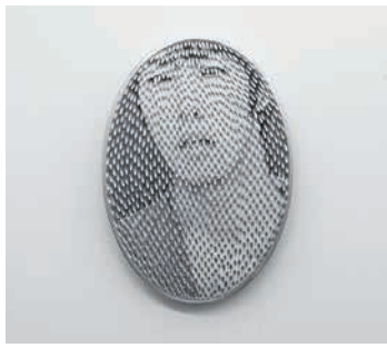
SCHMUCK - Takayoshi Terajima