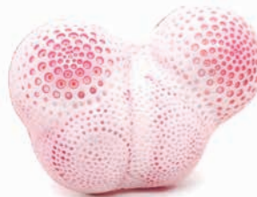
SCHMUCK - Olave Minizaga