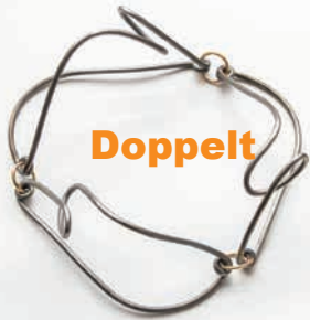
Galerie Marzee - Dorothea Prühl