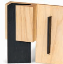
TALENTE - Le Woon Lim

Die Auswahl wurde von der Abteilung für Messen und Ausstellungen der Handwerkskammer für München und Oberbayern zusammengestellt, messe@hwk-muenchen.de