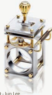
Gallery O - Jun Lee