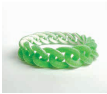
TALENTE - Benedict Haener