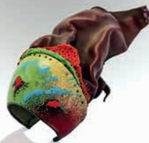
Aria Gallery - Abdolnaser Giv Ghassab