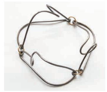
FRAME - Dorothea Prühl