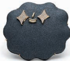
Galerie Noel Guyomarc'h - Aurélie Guillaume